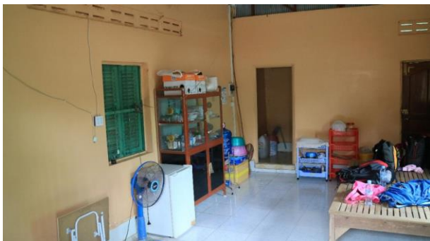
這就是雪英於烏棟村的房子，除小強外，還有鼠輩為伴。