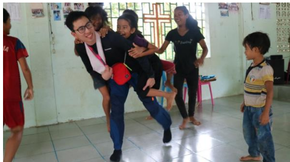
有猛男到訪，孩子們都扮起猴子來。